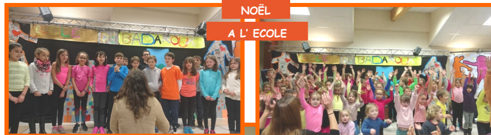
NOËL A L'ECOLE