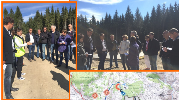
Visite du PRAE par le Conseil Municipal de Badaroux.