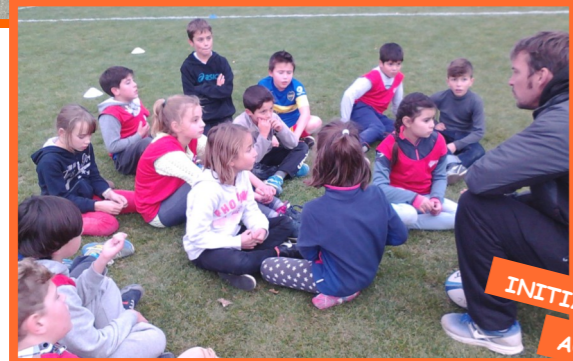
INITIATION AU RUGBY