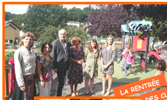
LA RENTRÉE DES CLASSES