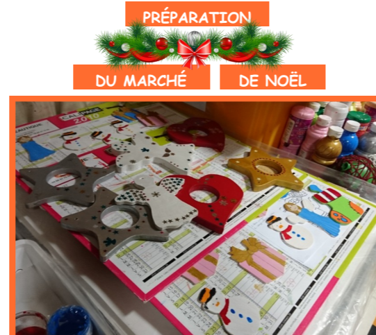
PRÉPARATION DU MARCHÉ DE NOËL