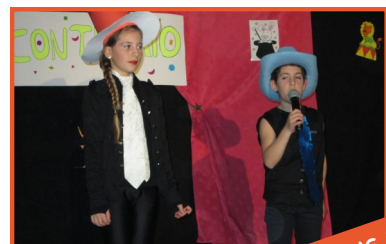
NOËL DANS LES ECOLES