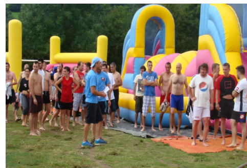
Fête de Badaroux