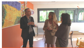
C'est la rentrée !