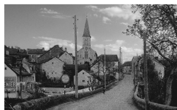
BADAROUX (Lozère) - La Route de Mende (1918 - 1933)