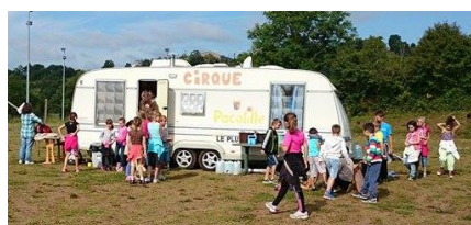
Festival du Môme au Cœur